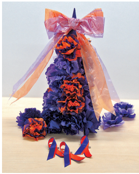
ミニツリーとリボン

キャンペーン期間中（11月1日（月）～30日（火））は、公共施設のライトアップや講演会などの催しが開催されます。