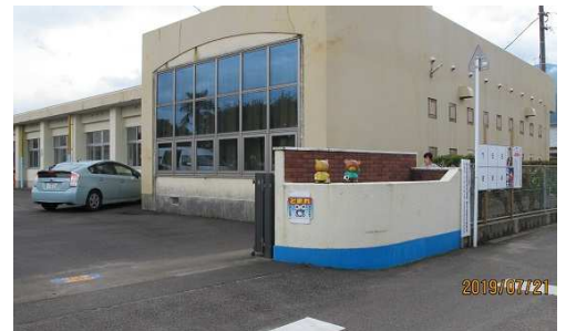
【04号の答】「口屋跡記念公民館」でした。

暑かった夏が終わり、ようやく秋らしくなってきたと思ったら、衆議員議員総選挙の日の発表があり、急にバタバタな日々を過ごしている今日この頃です。投票できる人は、大事な一票、忘れずに投票してくださいね。(うさぎ)