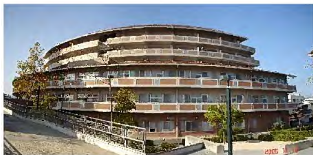
出展：広島市 HP より シルバーハウジング 江波沖住宅