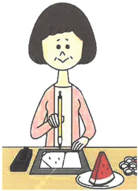
絵手紙ひよこ サークル活動中の一コマ