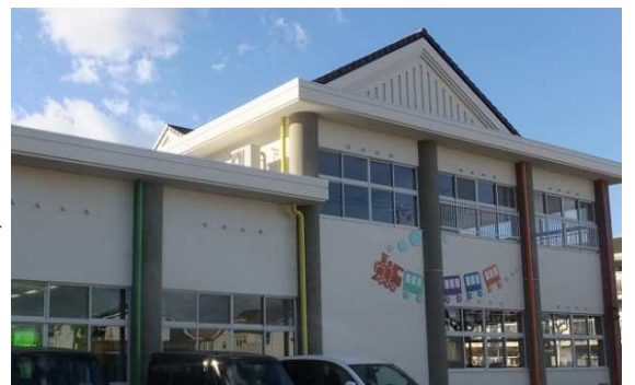
【02号の答】「東中学校体育館」でした。

【せんかん新聞 niihama】第3号 令和3年6月14日発行 発行者：新居浜市選挙管理委員会事務局 新居浜市一宮町一丁目5-1（市役所内） TEL65-1311 FAX65-1641 Mail senkan@city.niihama.lg.jp