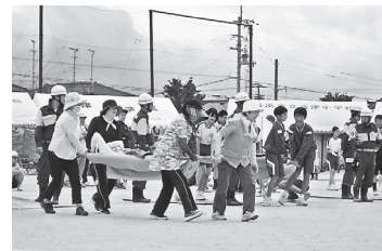
ふれあい祭り（運動会）