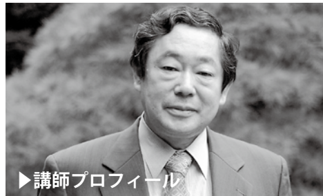
▶講師プロフィール