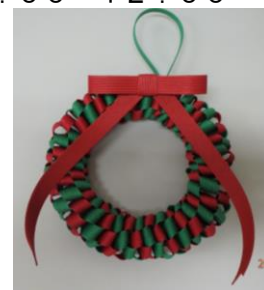
(見本は公民館にあります)