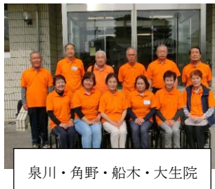
泉川・角野・船木・大生院

新居浜市健康増進計画「第2次元元気プラン新居浜21」を推進し、総合的な健康づくりに取り組むために、市長からの委嘱を受けて、現在87名の推進員がそれぞれの地域で活動しています。