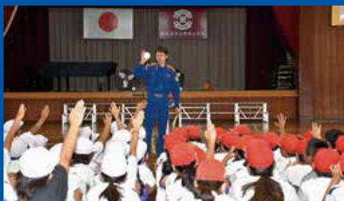
BFC（Boys and Girls Fire Club）活動

希望があれば家の中に入って、プロの目で安全を確認することもできます。皆さんのお住まいに消防関係者が来た際には、ご協力よろしくお願いします。