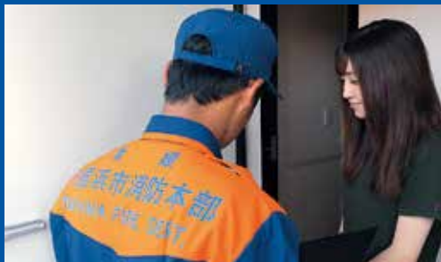
一般住宅などへの防火査察

新居浜市消防本部では、毎年4月から6月の間に、市内の住宅を約100件巡回し、住宅用火災警報器の設置状況調査を実施しています。また、春と秋の火災予防週間に消防団による住宅の防火診断も行います。