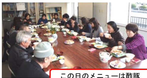
この日のメニューは酢豚