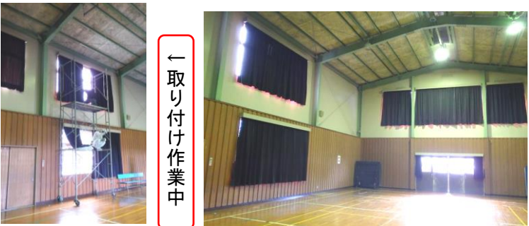
一取り付け作業中

公民館の体育館のカーテンが新しくなりました！(傷みが激しかった部分のみ)これで(当分は)西も南も大丈夫！