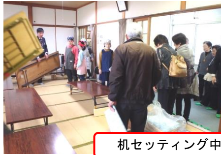
机セッティング中

2月8日(土)、香川県東かがわ市三本松より、地区活性化協議会として活動されている地域食堂『海月(くらげ)食堂』の18名の方々が、渦井せせらぎ食堂を見学に来られました。準備段階の調理風景、机のセッティングから、小学生たちの自発的にしている受付等を見られました。スペースの関係で参加者と一緒に食事はできませんでしたが、図書室で同じものを食べていただきました。その後、市社協の司会のもと、まさき育成園の理事長にも出席していただき、始まった経緯、ボランティアの確保、各団体との協力・連携などプロジェクターを使って説明しました。皆さん熱心に聞かれ、参考になる点も多くあったと喜んでいただきました。また海月食堂の紹介も受け、終始和やかで有意義な交流となりました。ありがとうございました！