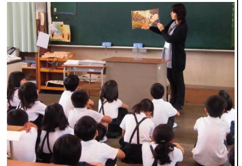
金栄小学校読み聞かせの会「ドリームツリー」