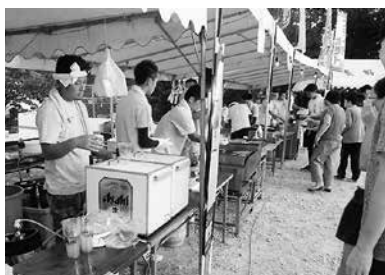
青壮年主催による長野夏祭り

だという青壮年が「長桃會」を結成し、太鼓台運行をはじめとする自治会運営の一翼を担っています。 長寿会では、PPK体操、秋の芋炊きなどを行っています。特に昨年から実施しているPPK体操では、自治会館が介護予防や健康づくり、仲間づくりの場として定着し、地域住民の交流の輪を広げています。 近年続いている自治会加入世帯の減少のため、コミュニケーションの在り方に不安を抱えているのが現状ですが、自治会活動を通して、先人が築いた「長野自治会の伝統」を継承し、後人への橋渡しをしていきます。