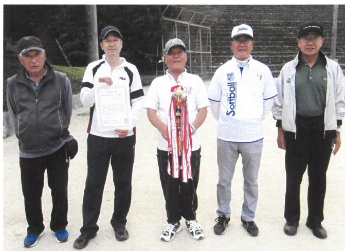
団体B 優勝 GG教室-A