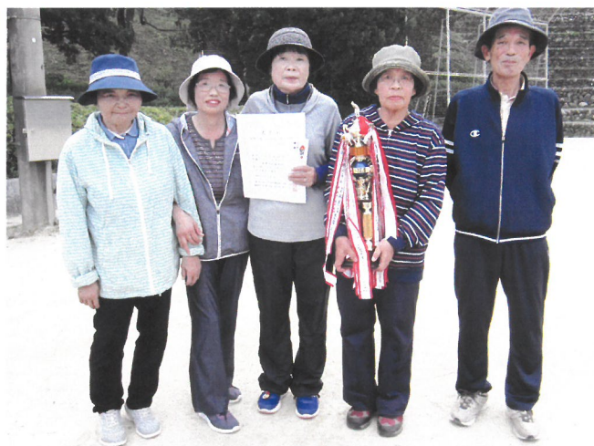
団体A 優勝 広瀬GG-D