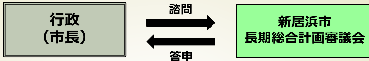
新居浜市長期総合計画審議会委員名簿 (案) (五十音順)