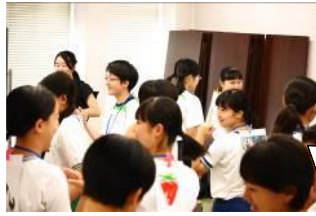
日本語は禁止です。

大学生企画の授業です。教員希望だけあって、大学でよく勉強されています。これは、自分の背中に書かれている絵を、他者に英語で質問しながら当てる活動です。果物、野菜、動物の絵が描かれています。