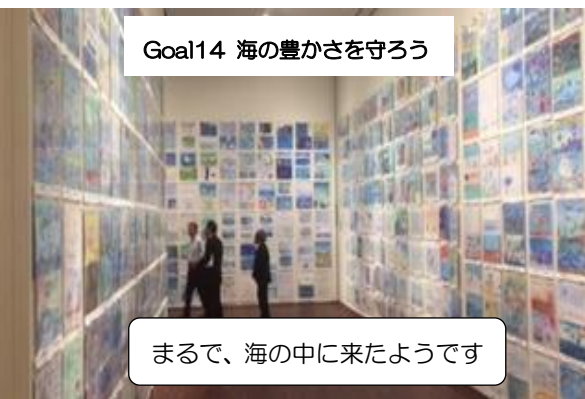
Goal14 海の豊かさを守ろう