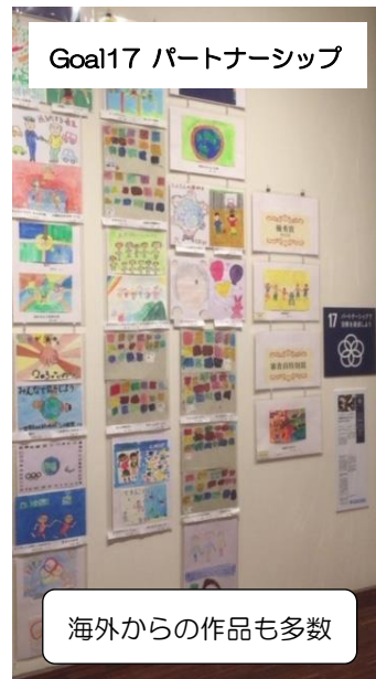
Goal17 パートナーシップ