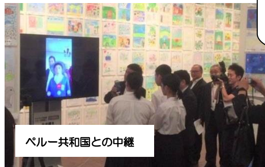
ペルー共和国との中継