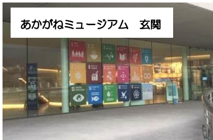
あかがねミュージアム 玄関