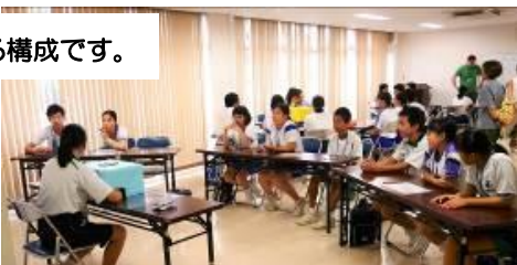
ALTの先生方が企画した授業です。