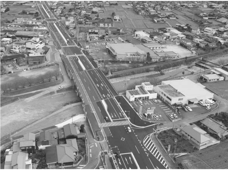
国道11号新居浜バイパス