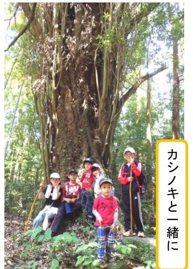
カシノキと一緒に