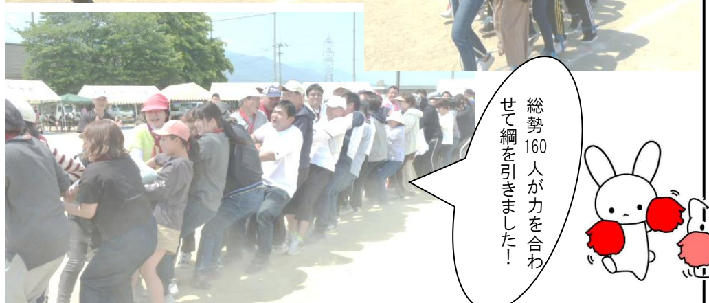
総勢160人が力を合わせて綱を引きました!