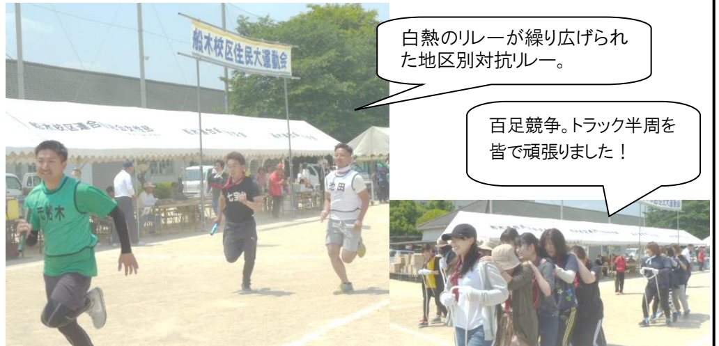
白熱のリレーが繰り広げられた地区別対抗リレー。