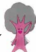
新居浜市環境推進キャラクター ロージー