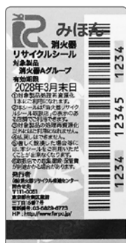
リサイクルシール 消火器 A グループ用