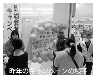
昨年のキャンペーンの様子

新居浜市連合自治会では毎年3月に加入促進街頭キャンペーンを実施しています。 今年も3月10日(日)の午前10時から12時まで、フジグラン新居浜で実施します。