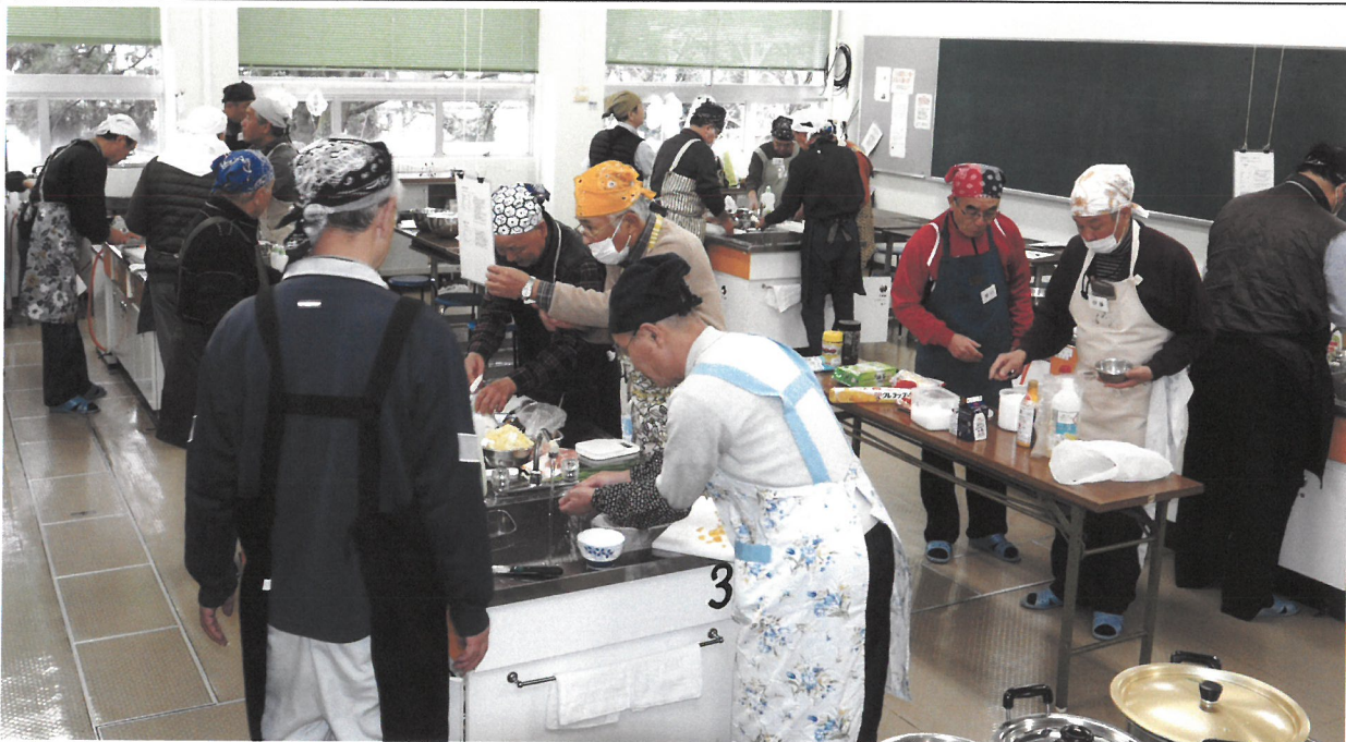
料理サークル「美味しんぼ」の活動風景