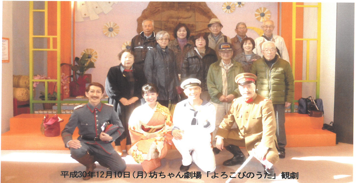
平成30年12月10日(月)坊ちゃん劇場「よろこびのうた」観劇