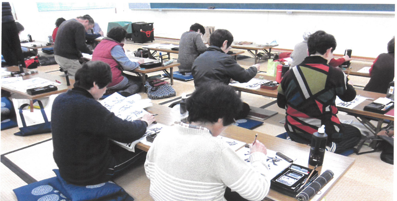
書道サークル「書楽」の活動風景