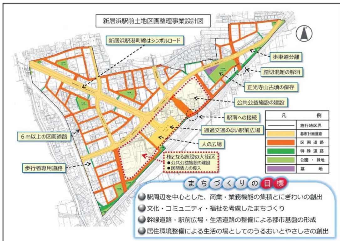
図表 新居浜駅前土地区画整理事業の概要

地元の代表からなる「まちづくり協議会」の意見を取り入れ基本計画を見直すなど、時間をかけた合意形成により、平成9年8月に都市計画決定し平成23年5月に工事が概成、平成29年度に事業が完了しています。