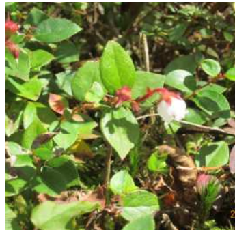
油断したのかアカモノが