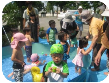
7/22のプール遊びの様子で