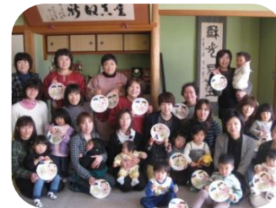
2/21 ちょっと早めのひなまつりの様子