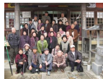
宝生寺・寿老人にて