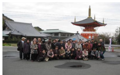
八淨寺・大黒天にて

「高齢者講座」平成23年2月24日(木)36名参加で、淡路島七福神めぐりに行ってきました。笑い声が絶えない楽しい研修旅行でした。ご参加下さいました皆さま、お疲れさまでした。