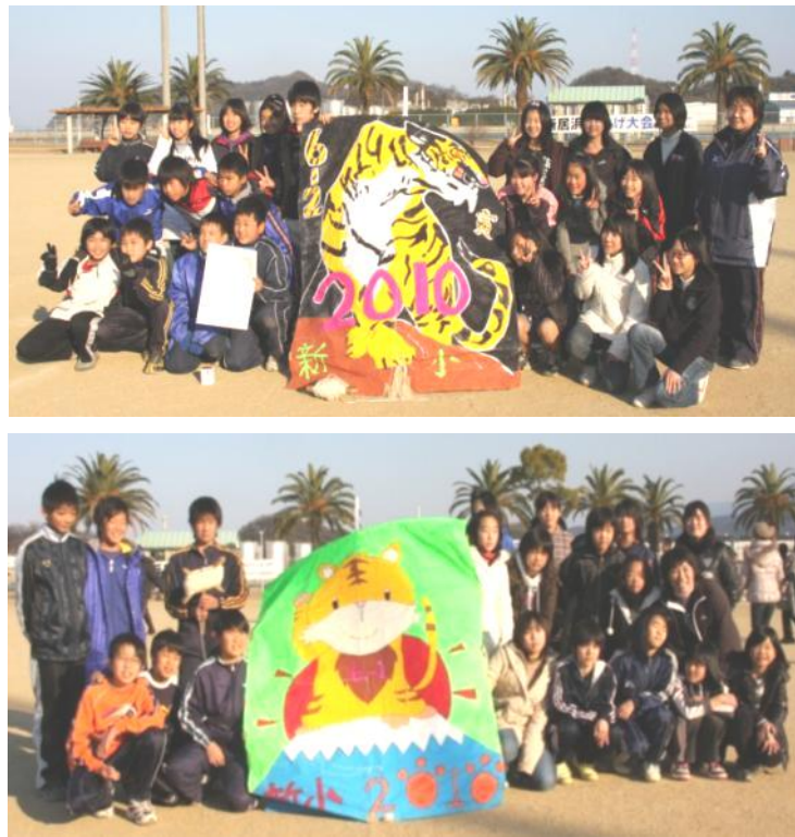
裏面には児童の感想文があります。

1月17日(日)にマリンパーク新居浜で凧あげ大会が開催され、約160の参加凧の中から新居浜小チームは、見事、チーフワーク賞を獲得しました。おめでとうございます。