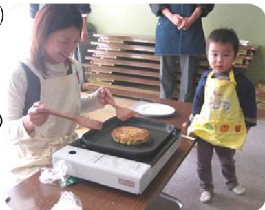
1/18 お好み焼教室の様子