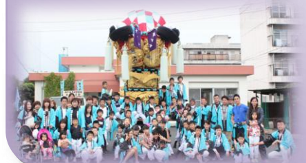
瀬戸・寿連合自治会 瀬戸・寿子ども会

今年も秋祭りの季節が近づいてきました。10月16日から始まる新居浜秋祭りは、高知のよさこい、徳島の阿波踊りと四国三大祭とされるお祭りです。17日に開催される山根の統一寄せでは、市政80周年の記念として、今までにない盛りだくさんのイベントを予定していて、今から「ワクワクドキドキ」ですね。私たち「瀬戸・寿子ども太鼓台」も参加します。町内で見かけたときはご声援、御花をよろしくお願ひしますね。子供太鼓台の組み立ては、瀬戸会館前にて10月8日(日)8時から行います。親御さんは勿論のこと自治会員の皆さま方のご協力を重ねてお願ひします。