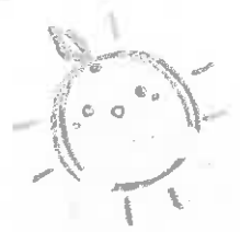
愛顔の子育て応援事業 ロゴマーク

国内有数の紙産業集積地である強みを活かして、県内紙おむつメーカー、市町と県が連携して、平成29年4月1日以降に第2子以降のお子さんを出生した子育て世帯に、下記の対象紙おむつを購入の際に利用できる50,000円分の「愛顔っ子応援券（市町により名称は異なります）」を交付し、子育て世帯を応援する事業です。