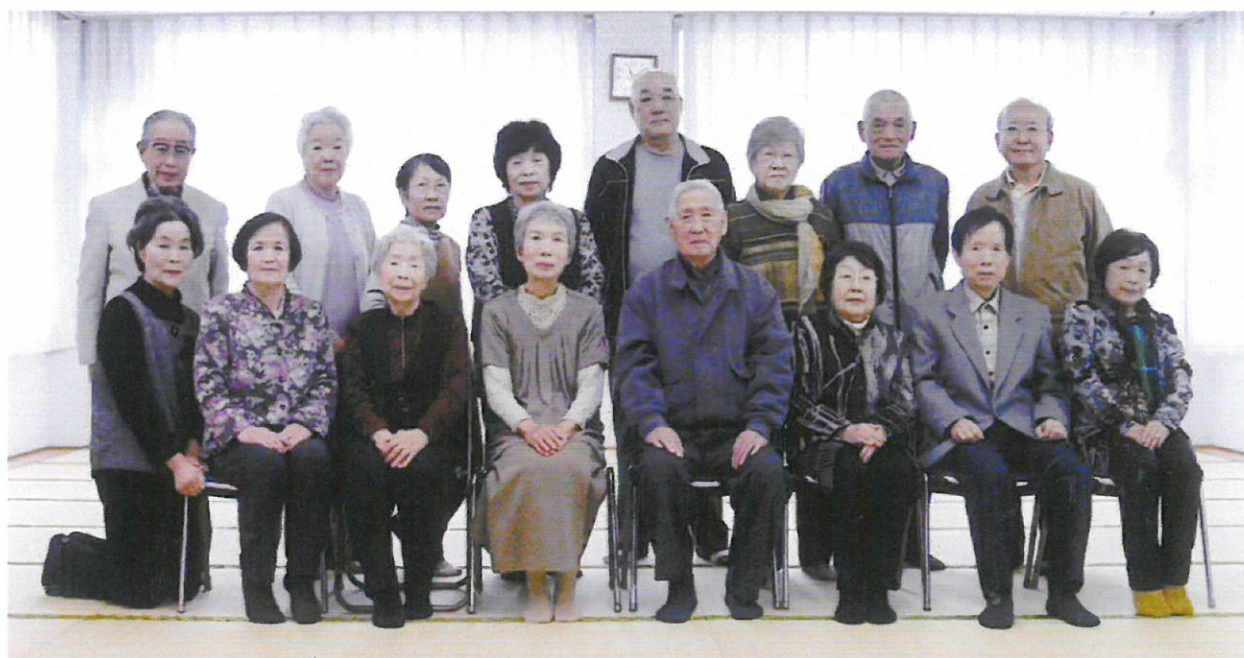
俳句サークル「あすなろ」の皆さん