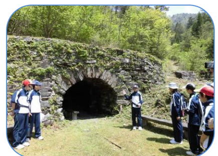
第一通洞跡での説明