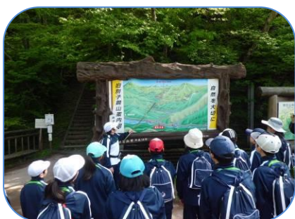
旧別子登山口での説明

平成29年5月14日（日）、新緑の輝く中、別子小・中学校の児童、生徒、保護者計41名による銅山峰登山が行われました。今年度は中学2年生がガイド役となり、自分たちが1年間かけて、学んだことを下級生や保護者に説明しました。上級生が自信をもって、別子のよさを伝える様子に下級生も大いに刺激を受けたようです。「宝の山 別子のよさ」を子どもたちが、主体的に学び、伝え、広げていく活動は大変意義があると思います。