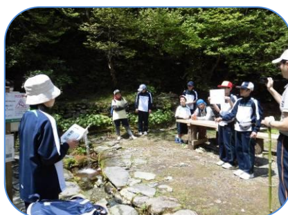
ダイヤモンド水にて