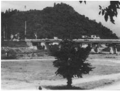
城下橋の近くか城址を望む