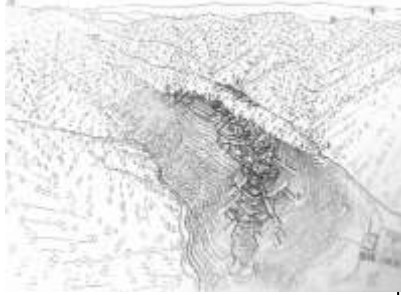
戦国時代の山城（砦）イメージ

郷連山の西の端、通称岡崎山に戦国時代に城があり、武将藤田山城の守が君臨し郷村など近辺の7か村を領していました。岡崎城については、これまで幾度かこの紙上で紹介してきたところです。藤田氏は、始祖太政大臣藤原鎌足公より出で、孫・友季は藤田の姓を名乗り、後醍醐天皇に仕えた南朝の忠臣でした。友季が伊予の守に任ぜられ、郷山に砦をつくったのは、1333年、今から約680年前の鎌倉時代です。