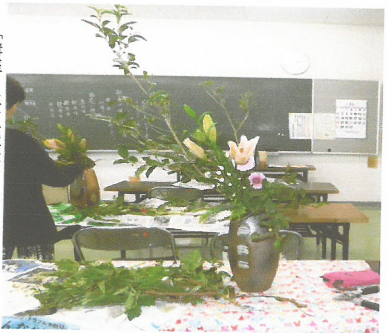
「講座 生け花教室」作品作り