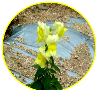
12月20日 少し大きくなりました

12月2日(金)、冬晴れのもとで、長寿会の皆さんに教えてもらいながら、船小3年生が池田池の花壇に650株の金魚草を植え付けました。春にきれいな花が咲くのが楽しみです。成長の様子を観察してみるのもいいですね。