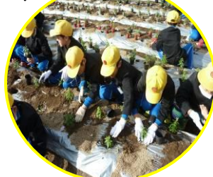
みんな 上手に植えています