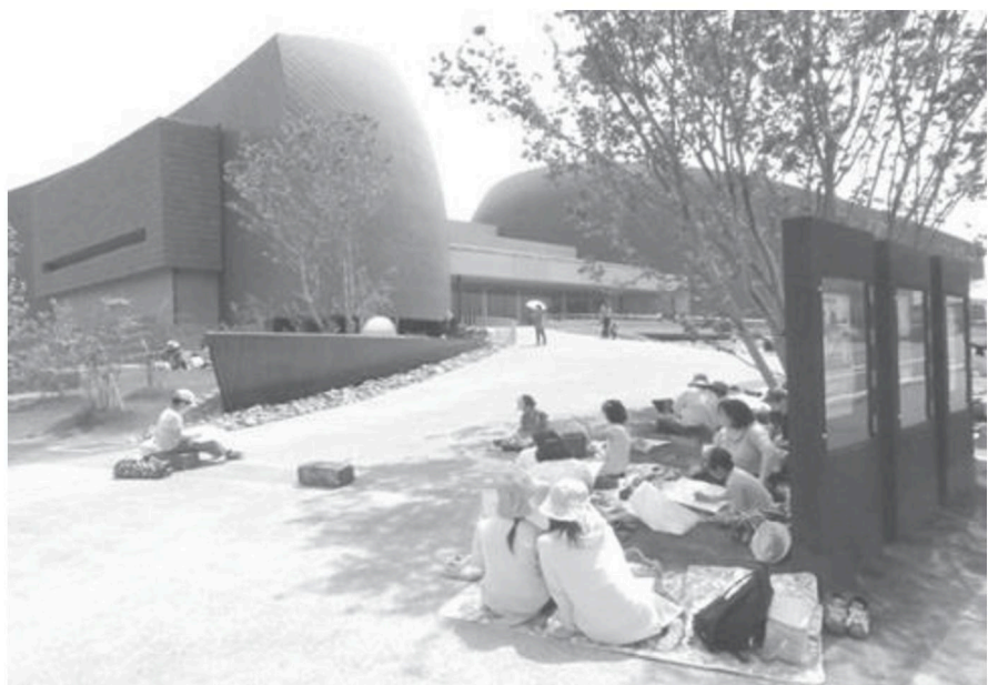
ふるさと写生大会