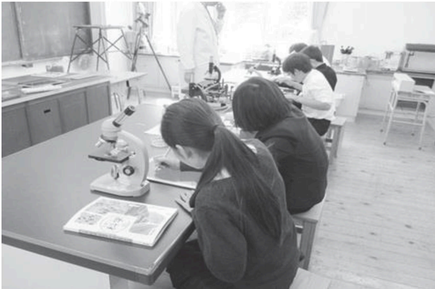
別子中学校学び創生事業