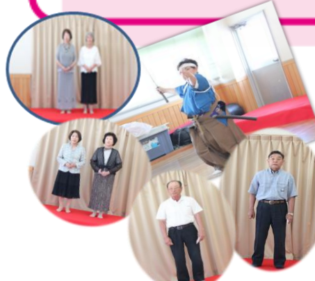
まちゆりも来たよ