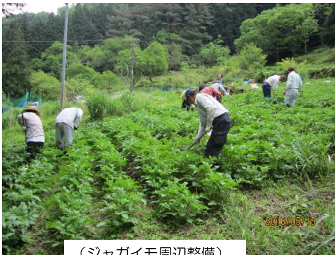
(ジャガイモ周辺整備)