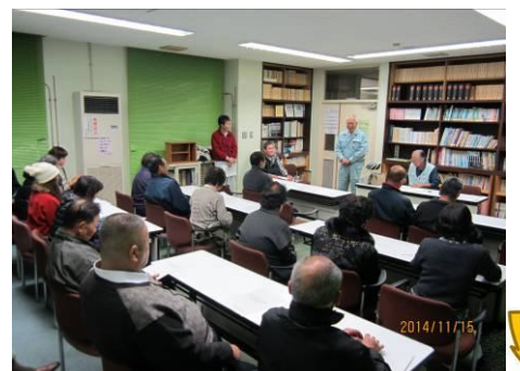
フォーラムの様子