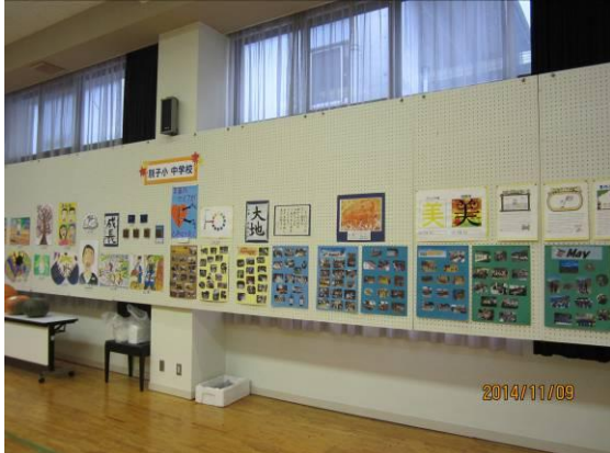
学校児童生徒さん作品