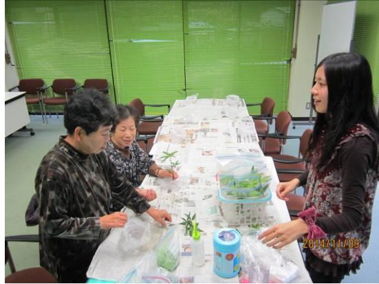
インテリア小物作り体験コーナー