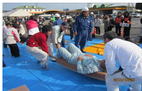
簡易担架作成搬送訓練の様子

平成26年10月26日(日)南海トラフ巨大地震などにより被害が発生したことを想定して、実践的な防災訓練を実施し、防災体制の充実強化、応急対策の機能向上を図るとともに、安全・安心な地域づくりに資することを目的に開催されました。