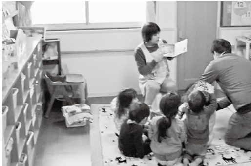
4月から増えた保育施設での保育の様子 (ちびっこワールドにいはいま園：船木)