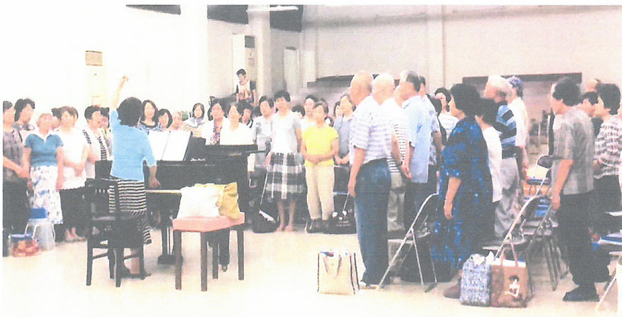
「コーラスひろせ」の皆さん