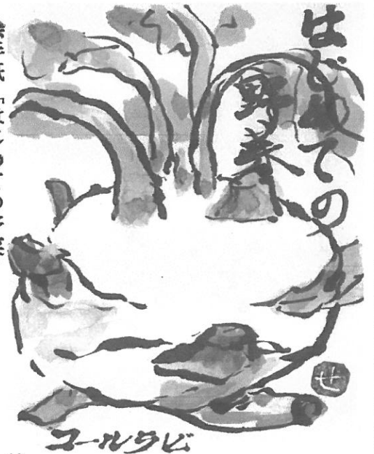
絵手紙「はじめての野菜」