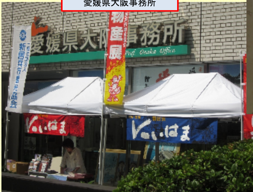
愛媛県大阪事務所