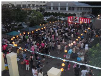
惣開校区夕涼み会実行委員会

恒例行事となりました惣開校区夕涼み会が、7月26日(土)に盛大に開催されました。Cisの吹奏楽演奏から始まり、拳法の迫力ある演武を披露してもらい会場も賑わっていました。美味しい焼き鳥、イカ焼き、から揚げ、焼きそば、アイス、むしくじ、など浴衣姿の子ども達でにぎわっていました。 メインイベントの豪華景品が当たる抽選会では歓声のため息が飛び交っていました。 例年よりも暑さが厳しくなる中、ステージの組立てや会場の設営など校区の皆様方のご協力により今年も無事に開催することができました。ありがとうございました。